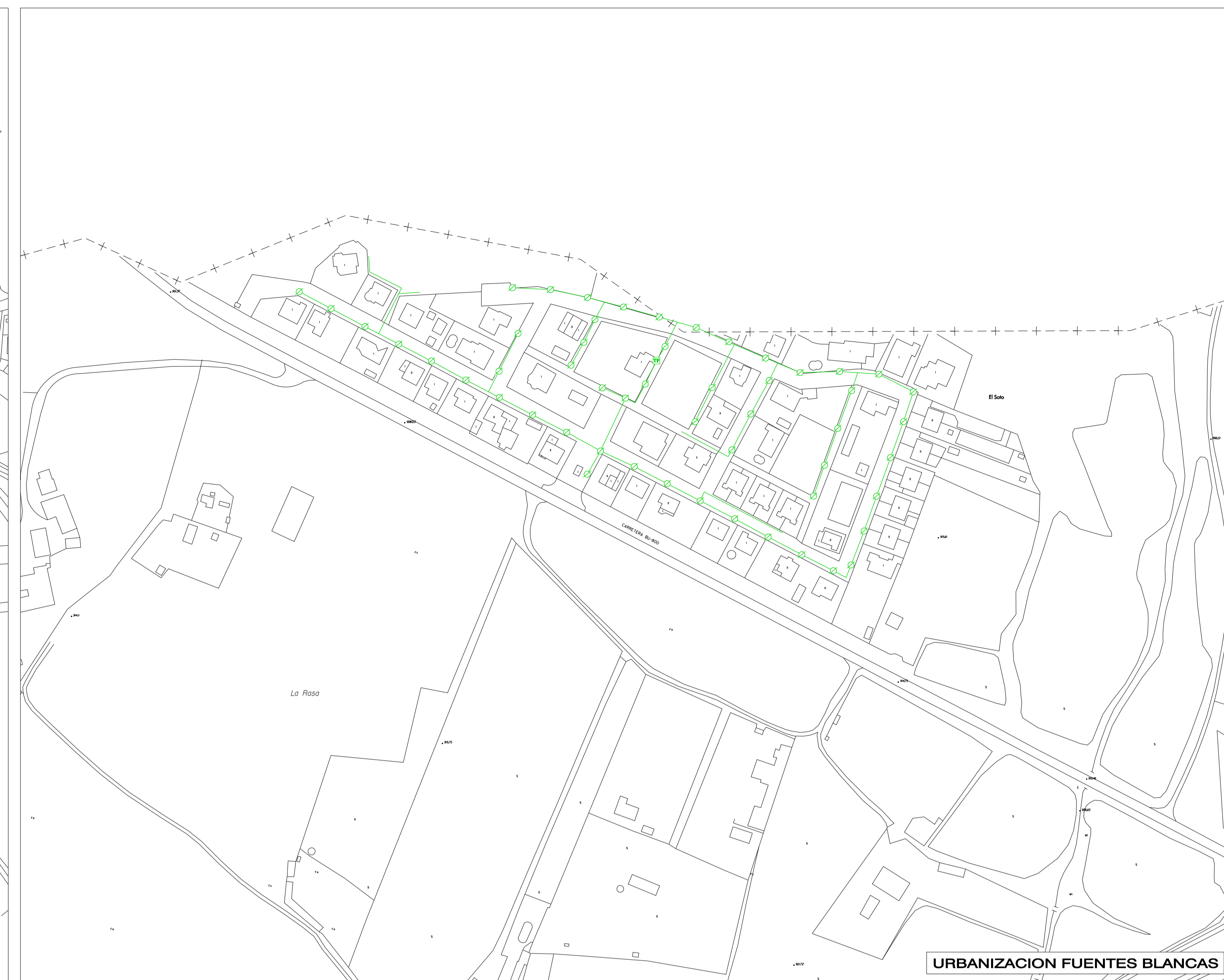
URBANIZACION FUENTES BLANCAS